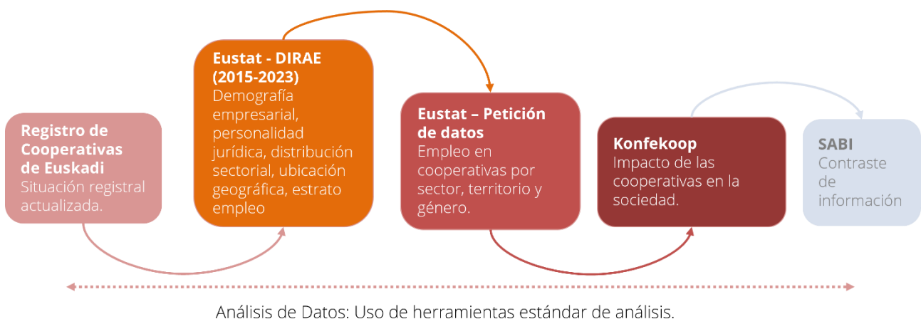
Ilustración 1 Fuentes de datos

El análisis de los datos obtenidos a partir de dicha fuente se ha realizado mediante la utilización de herramientas estándares de tratamiento de los datos.