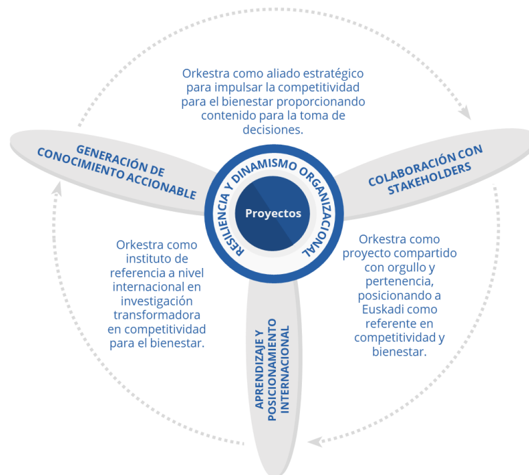
Figura 1. Ejes del PE 2021-2024

Toda la información de Orkestra está disponible en su página web: