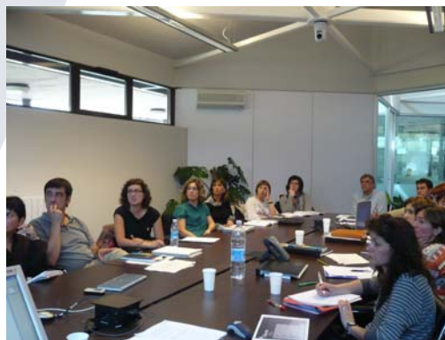
Participantes en los talleres