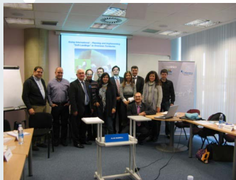
Going International, CEIA, Vitoria