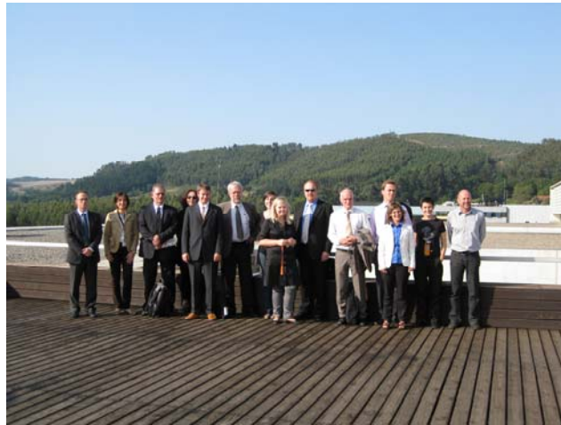
Las dos delegaciones en un momento de descanso durante la primera jornada

La visita de esta delegación (formada por representantes del Ministerio del Gobierno Local y Desarrollo Regional de Noruega, de Innovation Norway , del Consejo de Investigación de Noruega, de la Corporación para el Desarrollo Industrial y de la Universidad de Agder), fue fruto del interés que despertó la política clúster y de innovación del País Vasco cuando, el pasado mes de febrero, investigadores de Orkestra y representantes del Gobierno Vasco hicieron una visita a diversas instituciones noruegas.