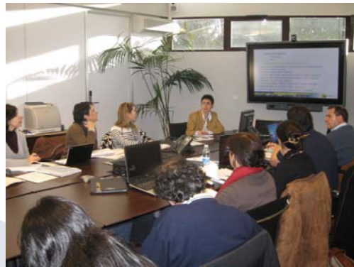
El desarrollo de uno de los talleres

Mediante el uso de diversas herramientas propuestas por Orkestra, doce agencias de desarrollo identificaron clústeres potenciales en su comarca, dando continuidad al proyecto iniciado el pasado mes de noviembre. Los talleres son parte del acuerdo marco de colaboración entre Orkestra, Garapen y el Departamento de Industria, Comercio y Turismo del Gobierno Vasco. San Sebastián, 15 de enero, 26 de febrero y 31 de marzo.