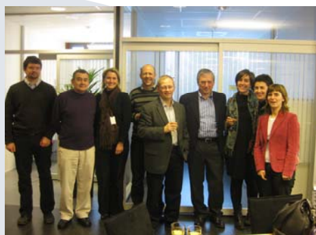
Los participantes en el taller